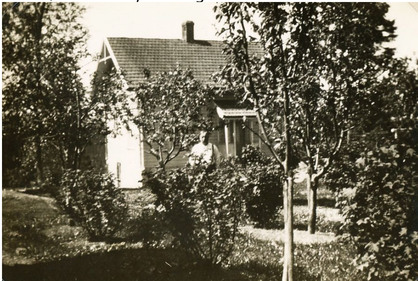
Sigurd utafør egenbygd bolig på Kolbotn.